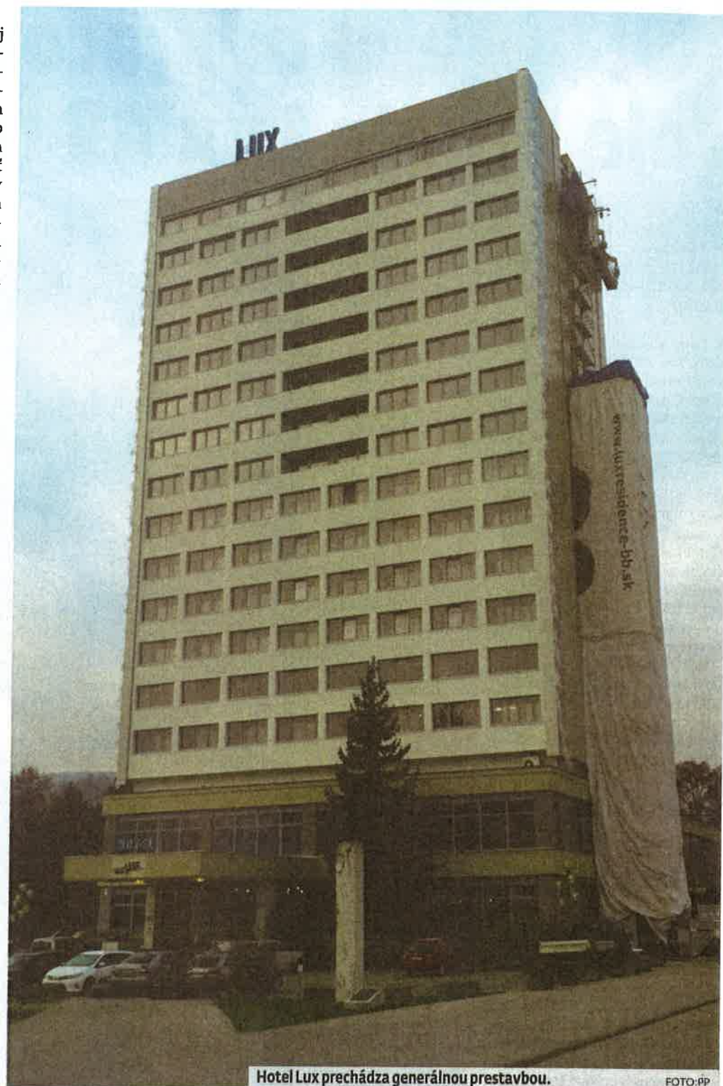
Hotel Lux prechádza generálnou prestavbou.

Po roku 1990 sa mnoho zmenilo. Z Hotela Lux sa stal samostatný štátny podnik, po privatizácii a likvidácii podniku Reštaurácie, sa hotel dostal do zo-